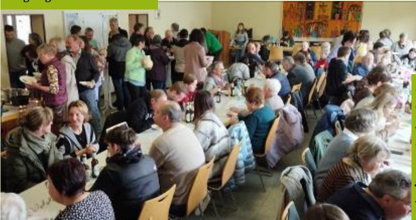
Danke an die Organi-satoren für eine rund-um gelun-gene Veran-staltung