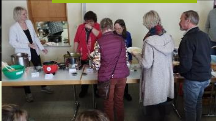
Da kaum etwas übrig ge-blichen ist, hat's wohl al-len gut geschmeckt...