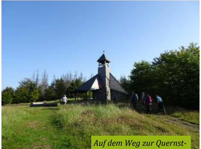
Auf dem Weg zur Quernstkapelle im Nationalpark Kellerwald

Nach dem offiziellen Teil war noch Zeit zum Austausch und zum gemeinsamen Kaffeetrinken.