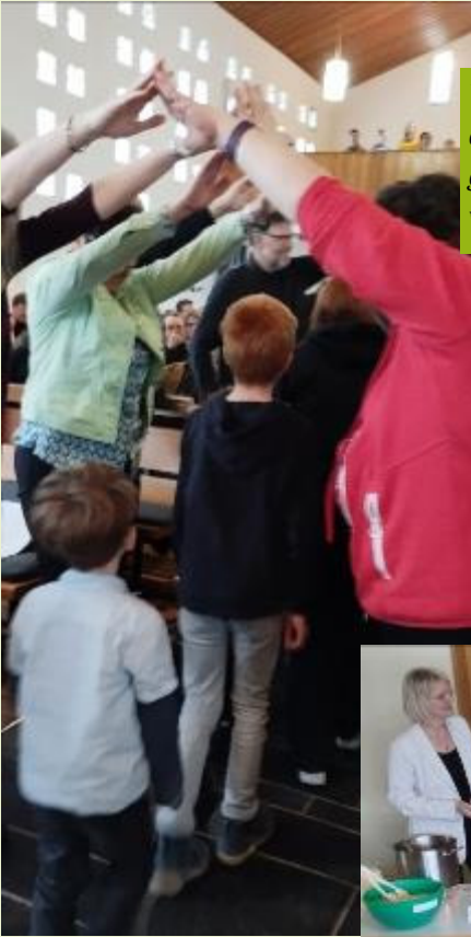
Vor der Predigt wurden die Kinder dann durch einen Segensbogen in den Kindergottesdienst verabschiedet